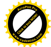
Tablica 2a Wymagane właściwości kruszywa łamanego drobnego lub o ciągłym uziarnieniu do D \leq 8\text{mm} do warstwy wiążącej z betonu asfaltowego